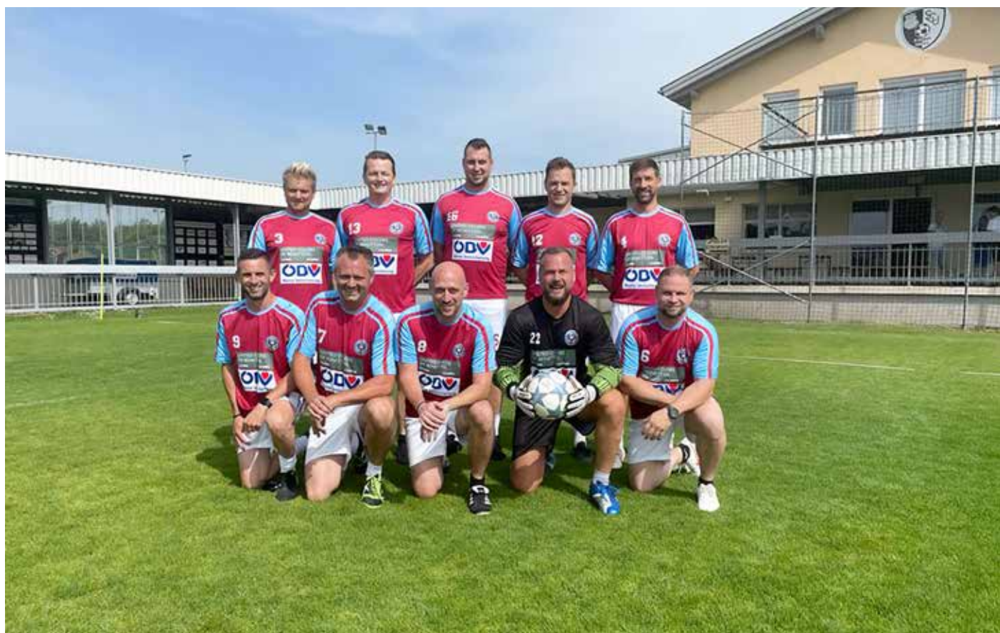
Siegermannschaft Landeskriminalamt NÖ