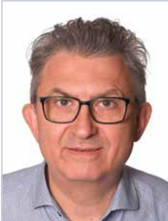
Adrian Frewein Redaktion Polizei Sport NÖ

W enn man die Geschehnisse auf dieser Welt tagtäglich beobachtet, könnte sich fast so etwas wie Verzweiflung, Ungewissheit, oder gar Resignation einstellen. Kriege und Katastrophen beherrschen große Teile unseres wunderschönen und einzigartigen Planeten. Noch dazu werden jetzt im Herbst die Tage immer kürzer und düsterer.