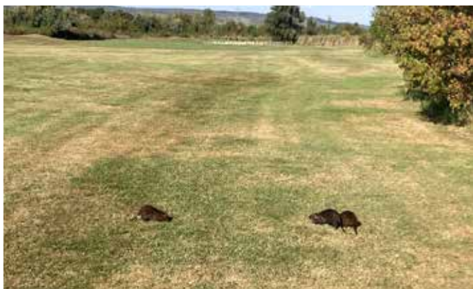
Noch kleine Nutria, welche für einen Schnappschuss auf Loch 15 posieren.

Trotz eines Spitzenergebnisses von Josef Pleyel am 04.10. qualifizierte sich die Mannschaft lediglich für das Spiel um den 7. Platz. Dort lautete der Gegner Burgenland. So musste die Mannschaft