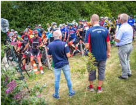
Kurz vor dem Start...