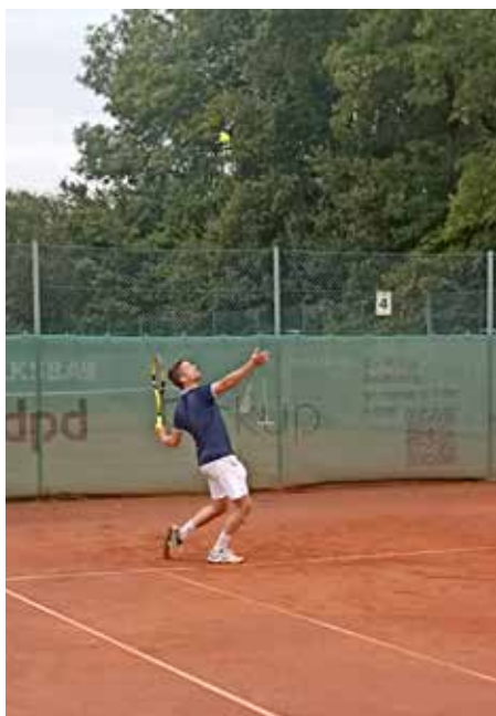
Ein grandioser Aufschlag

Das relativ ausgeglichene Match entschied letztlich Koppensteiner/Riedl für sich. Das Finale war geprägt von schnellen Schlägen und längeren Ballwechseln auf gutem Meisterschaftsniveau. Faustmann und Goll waren jedoch auch heuer wieder eine Klasse für sich und holten sich erneut souverän mit 6/2 6/2 im Endspiel den Landesmeistertitel. Das Spiel um Platz 3 verlief etwas ausgeglichener. Die Paarung Ressler/Hohaus entschied dieses in zwei Sätzen für sich und gewann mit 6/4 6/4 gegen die Paarung Müllner/Rechberger.