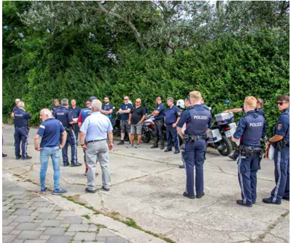
Für die Verkehrssicherheit wurde gesorgt...